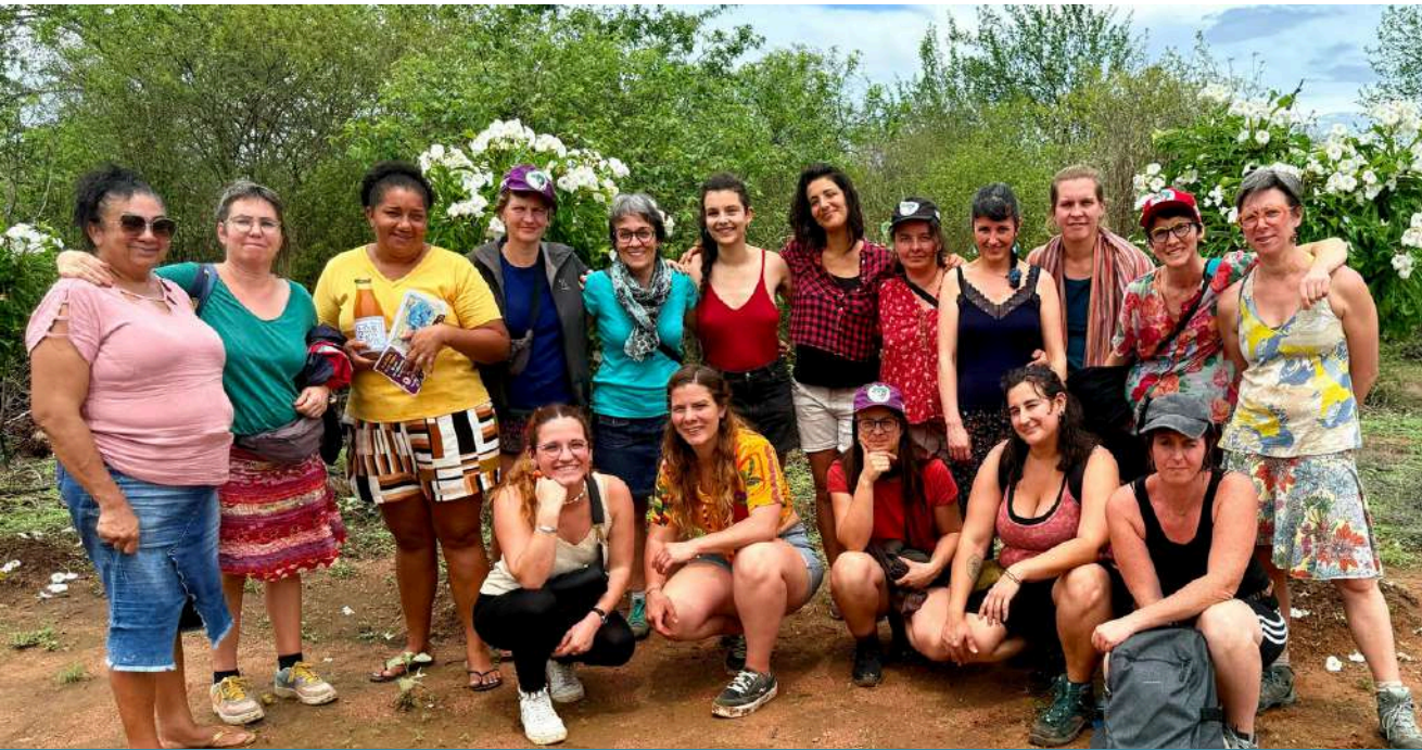
ENVOI D'UNE DELEGATION DE 13 FEMMES PAYSANNES AU BRESIL