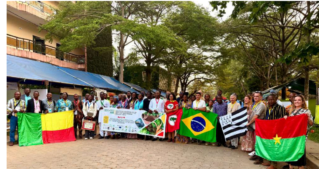
ORGANISATION D'UN COLLOQUE INTERNATIONAL AU BENIN

OBJECTIF : Favoriser le passage à l'échelle de la filière rizicole agroécologique au Burkina Faso, grâce à un partage d'expériences du Mouvement des Sans Terre, premier producteur de riz biologique d'Amérique Latine