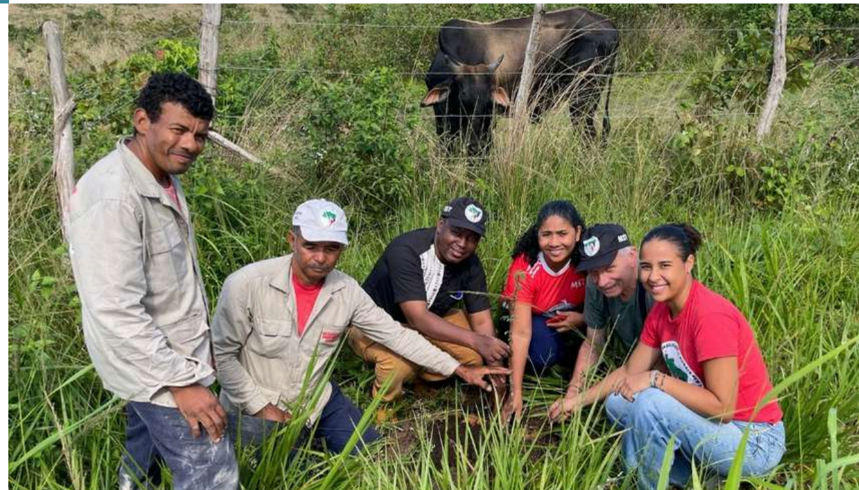
DELEGATION FRANCAISE ET BURKINABE AU BRESIL

OBJ : Faire des intrants organiques, un levier de souveraineté agricole et environnementale, en mettant à l'échelle leur production et leur valorisation.